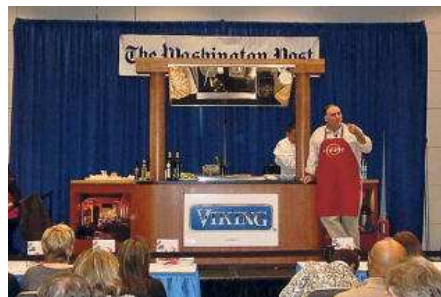
Uno de los muchos actos del festival gastronómico.

El Consello Regulador de O Ribeiro apuesta por el mercado estadounidense, por lo que presentó sus vinos en la Washington D.C. Food and Wines Festival. Una primera acción promocional en América que parece fue todo un éxito, en la que obtuvo los objetivos que pretendía de conseguir contactos con importadores y dar a conocer las cualidades de los caldos de esta denominación que no deja de buscar otros horizontes.